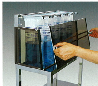
URカバー (標準架台用)