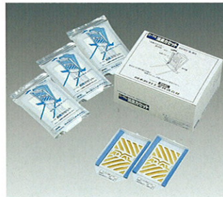
消臭カセット (20枚入)