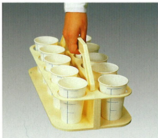
尿コップキャリア