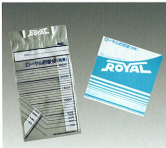
ローヤル貯尿袋 (消臭) 2500cc 100枚入