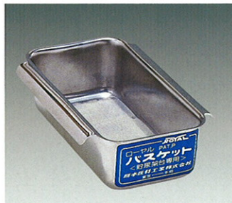
ローヤルバスケット (流出異物採集器)